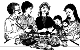
Alimentación para la buena salud

Es bueno conocer los alimentos importantes para las mujeres embarazadas.